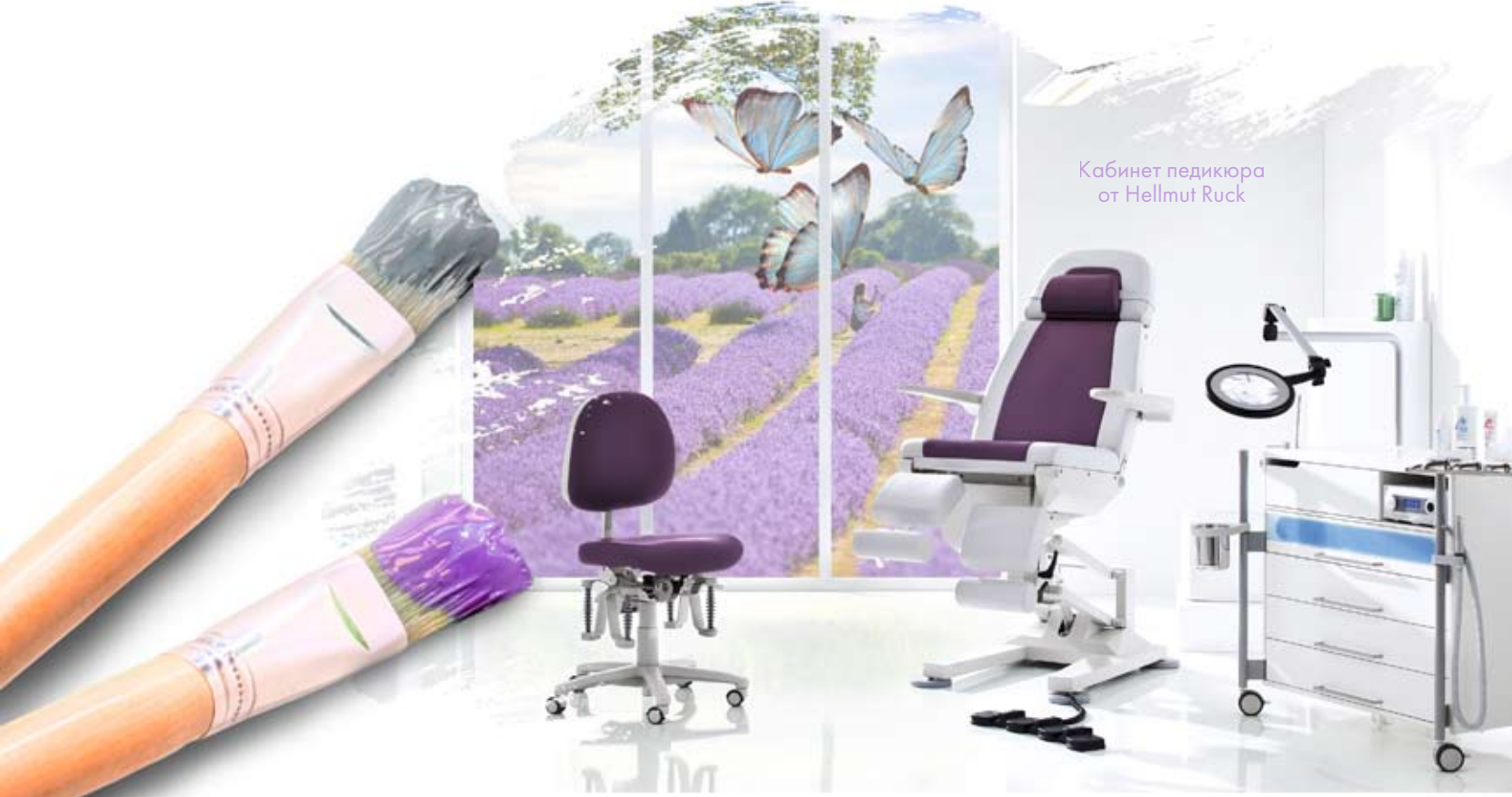
Кабинет педикюра от Hellmut Ruck

САЛОН БАНИ & СПА ПРЕДСТАВЛЯЕТ ЭКСКЛЮЗИВНЫЕ НОВИНКИ КРАСОТЫ.